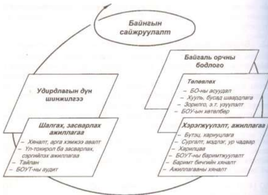
1-р зураг - ISO 14001:1998 стандартын байгаль орчны удирдлагын тогтолцооны загвар