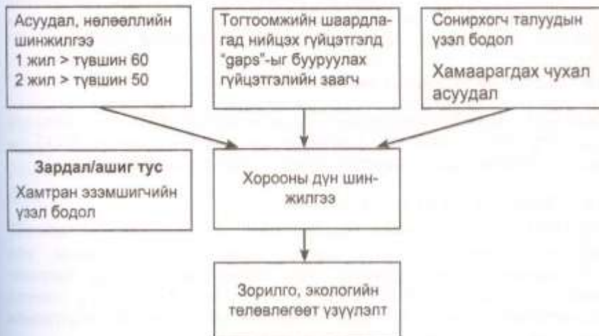
4-р зураг – Зорилго, экологийн төлөвлөгөөт үзүүлэлтийг ашигласан шалгуур

ISO 14001 нь байгууллагын ажиллагааны байгаль орчны чухал асуудлыг тооцох, байгаль орчны бодлоготой нийцэх байгаль орчны зорилго, экологийн төлөвлөгөөт үзүүлэлтийг тогтоохыг шаарддаг (4-р зургийг үз). Байгууллагын зорилго, экологийн төлөвлөгөөт үзүүлэлтэд дүн шинжилгээ хийж, тогтооход хууль зүйн болон бусад шаардлага, байгаль орчны чухал асуудал, технологи, санхүү, үйл ажиллагааны болон бизнесийн шаардлага, сонирхогч талуудын үзэл бодол ач холбогдолтой (ISO 14001:1996, 4.3.3).