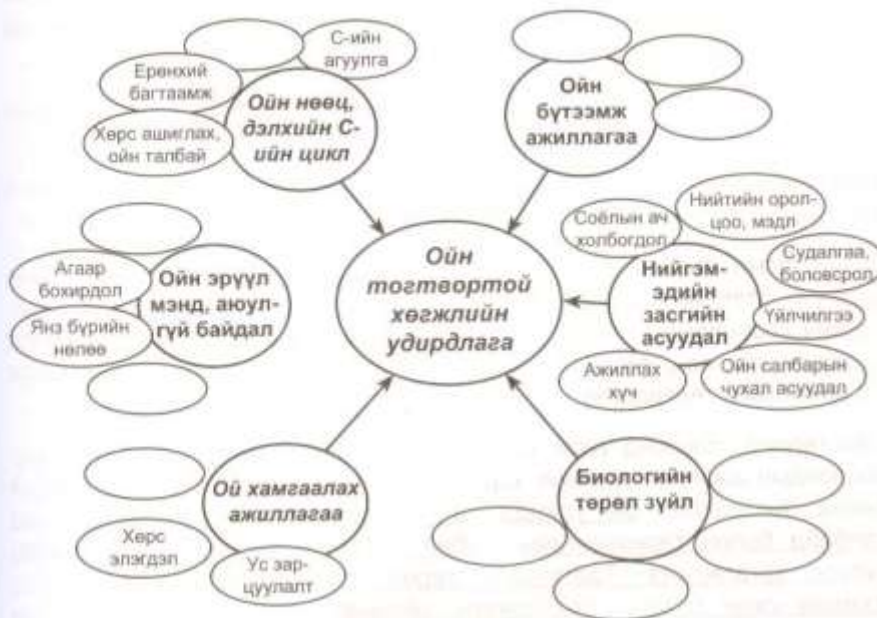
2-р зураг – ОТХУ-ын Пан-Европын шалгуур, заагч